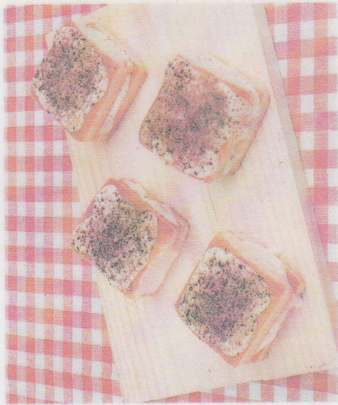
A. Producto final